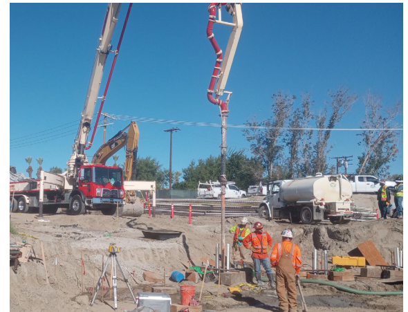
Cuadrillas colocando concreto en el molde de acero alrededor del pilote de acero.