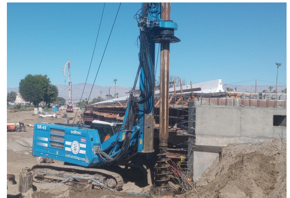
Las cuadrillas perforan hoyos de 40 a 50 pies de profundidad en el canal de tormenta para los cimientos de acero y el concreto.