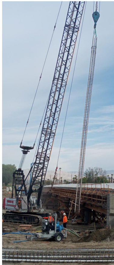
Cuadrillas colocando los castillos de barras de refuerzo prefabricados en el agujero perforado con el pilote de acero, que luego se llena con hormigón.

Dune Palms Road en el lado norte del puente en el área de construcción ha sido demolido para hacer espacio y construir el tramo del puente en dirección sur. Las cuadrillas retirarán los escombros del puente esta semana, por favor estén atentos a los camiones que ingresan y entran al lugar de trabajo.