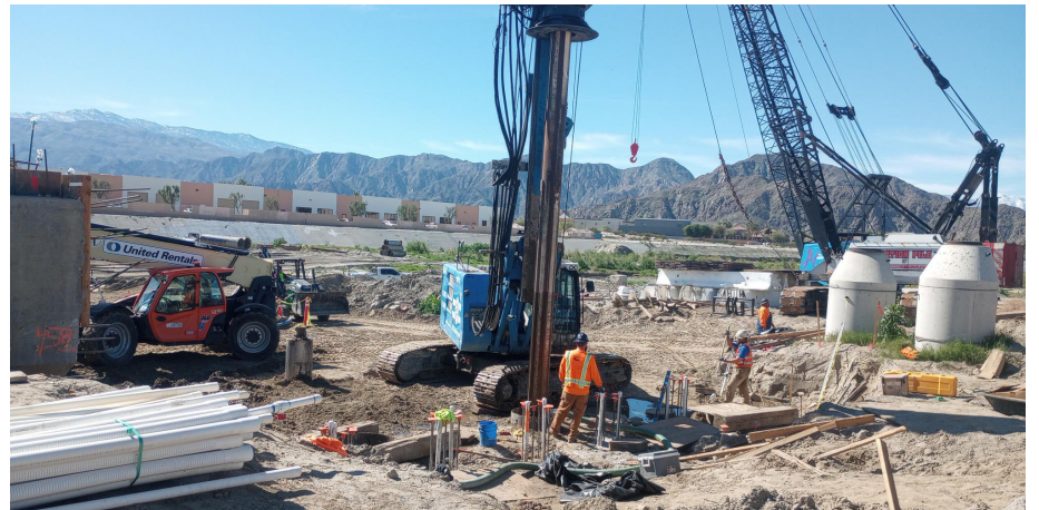
Las cuadrillas perforan pozos de 50 pies de profundidad en el canal de aguas pluviales del Valle de Coachella para el sistema de soporte subterráneo del puente en dirección sur.