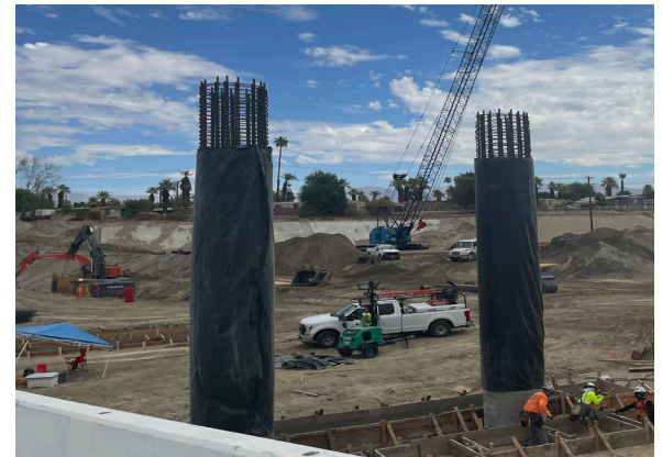
Las cuadrillas trabajando en la construcción de cimientos de puentes.

Las cuadrillas continúan construyendo los cimientos del tramo del puente este. La construcción de columnas y los trabajos de estribo están en progreso con colocaciones de concreto programadas semanalmente. Los contratistas trabajarán en construir la estructura de la cimbra del puente. Las cuadrillas continúan con las instalaciones de la línea de flotación.