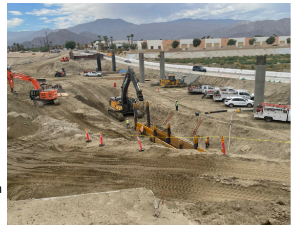
Los contratistas que trabajan en el apuntalamiento para instalaciones de líneas de flotación.