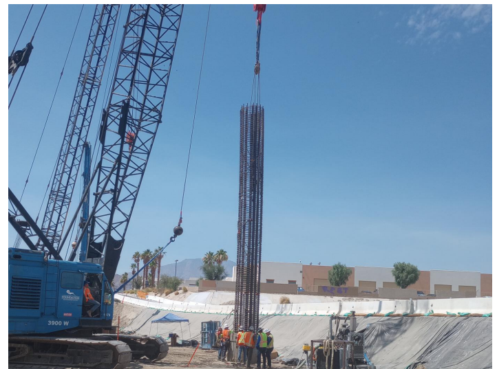
Las cuadrillas perforan y se preparan para colocar en el cimiento la siguiente base de soporte del puente con barras de refuerzo de 60 pulgadas de diámetro.